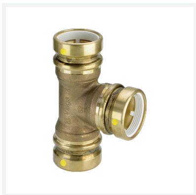
Geopress-T-Stück mit SC-Contur Modell 9618G Artikel 805 296