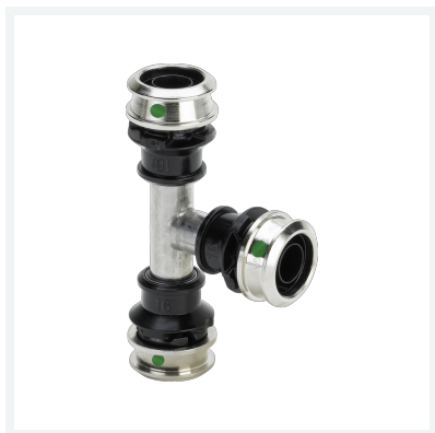
Raxinox-T-Stück mit SC-Contur - Pressanschlüsse Modell 4418