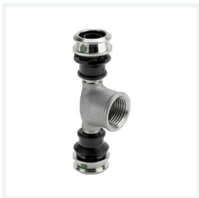
Raxinox-T-Stück mit SC-Contur Modell 4417 Artikel 724 207