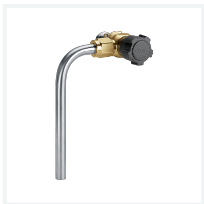
Easytop-Probenahmeventil Modell 2223.1 Artikel 708 726