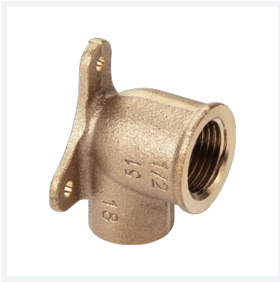
Wandscheibe - Lötanschluss, Rp-Gewinde Modell 94471G