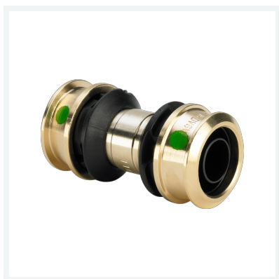
Raxofix-Kupplung mit SC-Contur - Pressanschluss Modell 5315