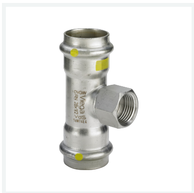
Sanpress Inox G-T-Stück mit SC-Contur Modell 0217.2 Artikel 486 662