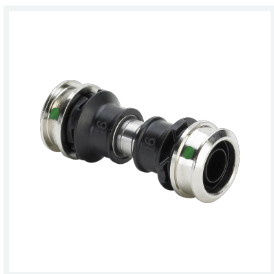
Raxinox-Kupplung mit SC-Contur - Pressanschlüsse Modell 4415