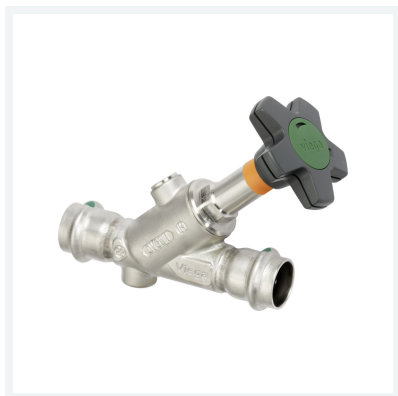
Easytop Inox-Schrägsitzventil (Freistromventil) mit SC-Contur Modell 2337.5 Artikel 757 878