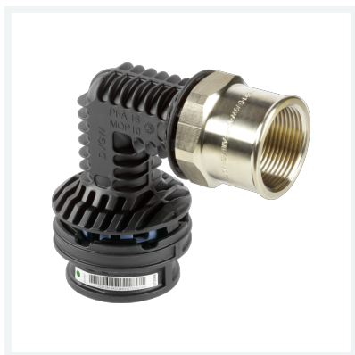
Geopress K-Übergangsbogen 90° mit SC-Contur Modell 9714.2TW Artikel 822 378