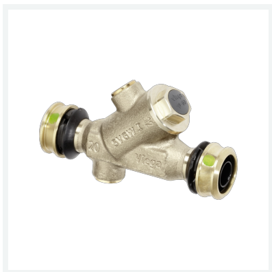
Easytop-Rückflussverhinderer mit SC-Contur Modell 5339.4 Artikel 758 301