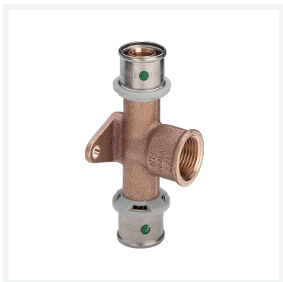
Sanfix P-Wandscheiben-T-Stück mit SC-Contur - Pressanschlüsse, Rp-Gewinde Modell 2125.8