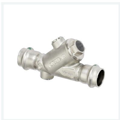
Easytop Inox-Rückflussverhinderer mit SC-Contur Modell 2339.4 Artikel 757 991