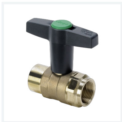
Easytop-Kugelhahn Modell 2275.2 Artikel 746 827