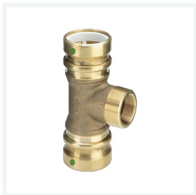
Geopress-T-Stück mit SC-Contur Modell 9617.1TW Artikel 767 198