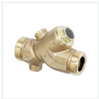
Easytop-Rückflussverhinderer Modell 2239.3 Artikel 757 649