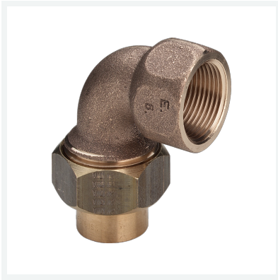
Übergangverschraubung 90° Modell 94096G Artikel 119 461