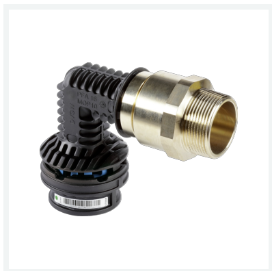
Geopress K-Anschlussbogen mit SC-Contur Modell 9720.1TW Artikel 822 828