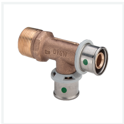
Sanfix P-T-Stück mit SC-Contur Modell 2126.4 Artikel 303 297