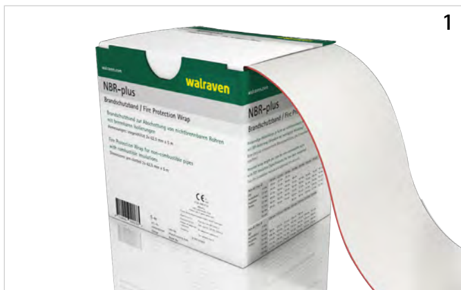
Bei Einbau in Decken wird der Wickel nicht geteilt.