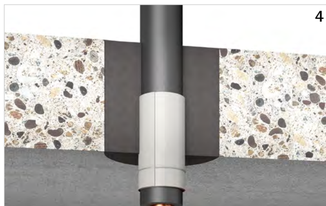
Ringspalt verschließen, z.B. mit Walraven Pacifyre® FPM Brandschutzmörtel, Beton, Zementmörtel oder Gips.