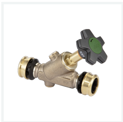
Easytop-KRV-Schrägsitzventil (Kombiniertes Freistromventil mit Rückflussverhinderer) mit SC-Contur Modell 5338.5 Artikel 758 196