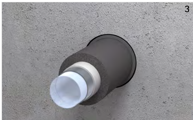
Bandage in Bauteilöffnung schieben (bündig mit Bauteiloberfläche).