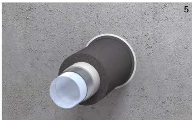
Ggf. Kontrolle der Abschottung.