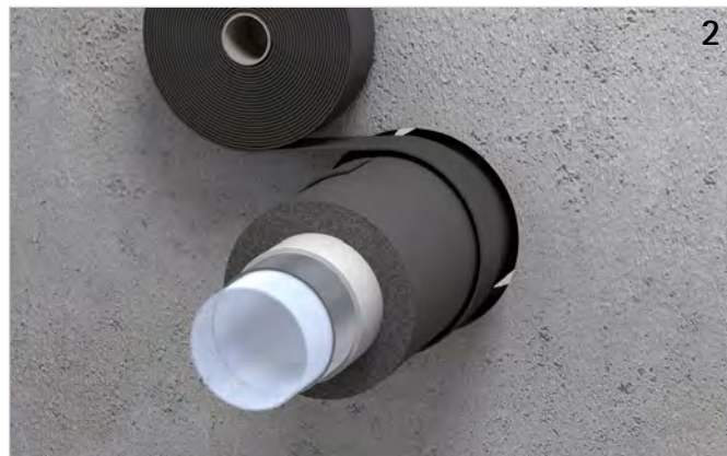
Bandage um Rohrleitung (bzw. Dämmung) legen (Lagenanzahl beachten!) und Überlappung (ca. 20 mm) verkleben.