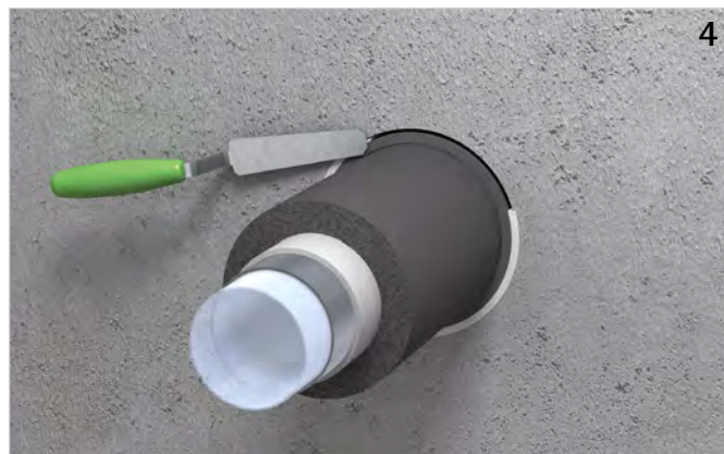
Rest- bzw. Ringspalt rauchgasdicht (mit z. B. Walraven Pacifyre® FPM Brandschutzmörtel) verschließen.