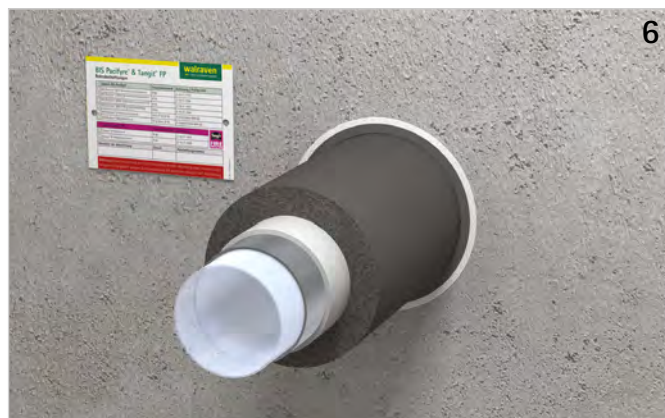
Das Kennzeichnungsschild ausfüllen und neben der Abschottung anbringen.