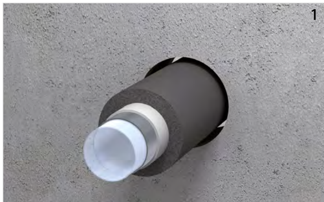
Rohrleitung (ggf. mit FEF-Isolierung) installieren.