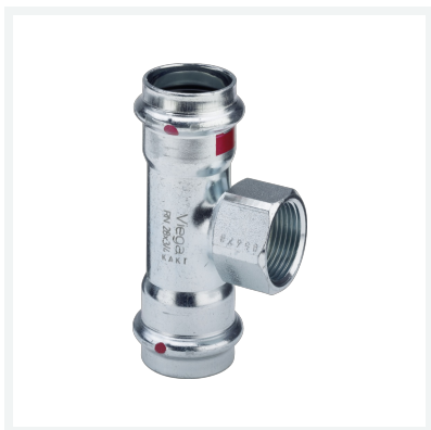
Prestabo-T-Stück mit SC-Contur Modell 1117.2 Artikel 704 704