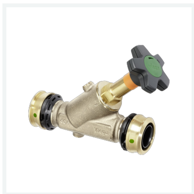
Easytop-KRV-Schrägsitzventil (Kombiniertes Freistromventil mit Rückflussverhinderer) mit SC-Contur Modell 5338.5 Artikel 758 226