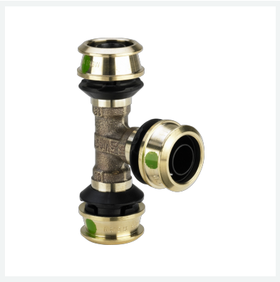
Raxofix-T-Stück mit SC-Contur - Pressanschlüsse Modell 5318