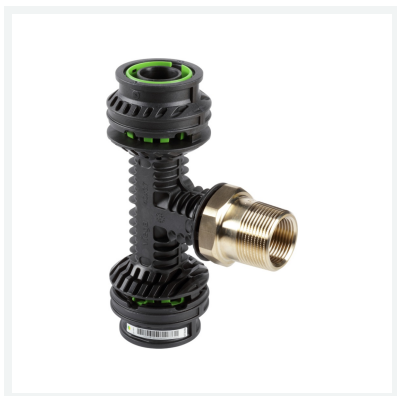
Geopress K-T-Stück mit SC-Contur Modell 9717.1 Artikel 711 313