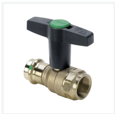
Easytop-Kugelhahn mit SC-Contur Modell 2275.4 Artikel 746 766