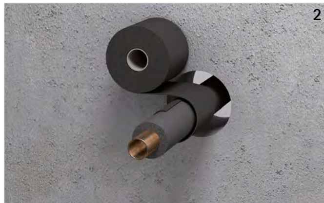
Rohrummantelung um die Dämmung legen (Lagenzahl beachten!) und Überlappung (ca. 20 mm) verkleben.