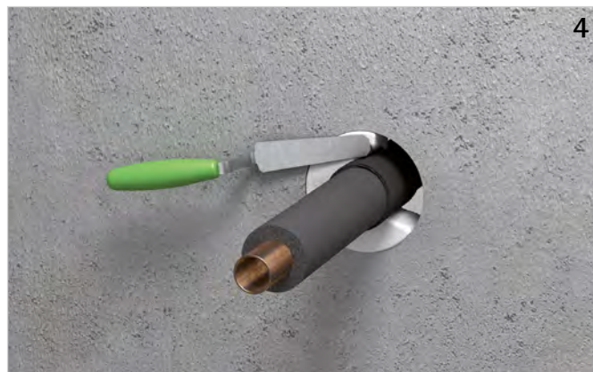
Ringspalt rauchgasdicht (mit z. B. Walraven Pacifyre® FPM Brandschutzmörtel) verschließen.