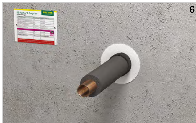
Das Kennzeichnungsschild ausfüllen und neben der Abschottung anbringen.