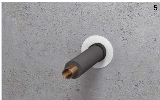
Ggf. Kontrolle der Abschottung.