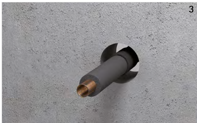
Rohrummantelung in die Bauteilöffnung schieben (Überstände beachten).