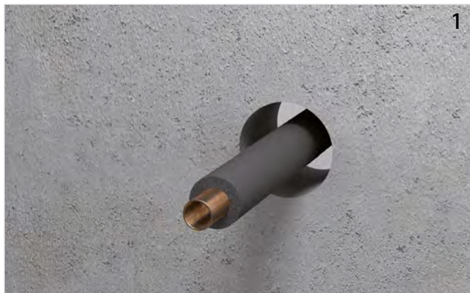
Rohrleitung mit Dämmung installieren.